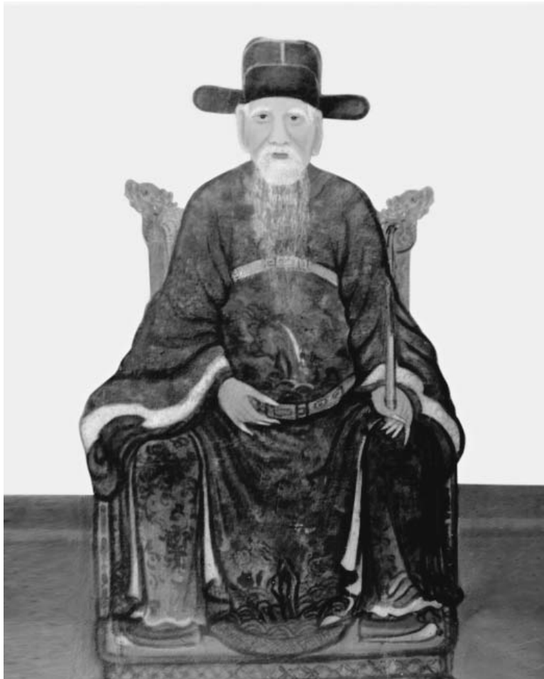
NGUYỄN TRÃI (1380 - 1442)