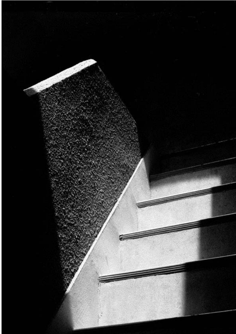
Bên Thềm Nắng Cũ