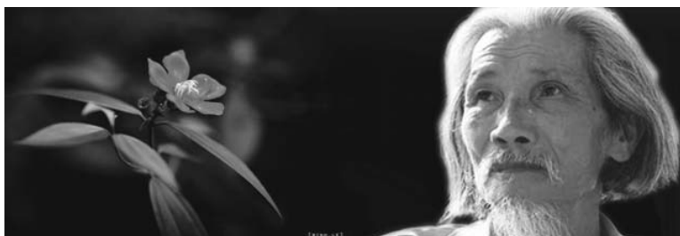
Thi sĩ Hữu Loan (1916 - 2010)