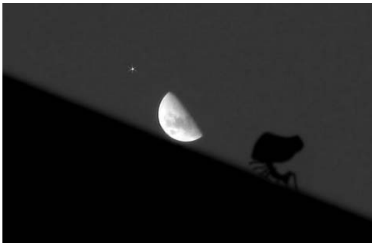
Dốc Trăng Cổ Xứ